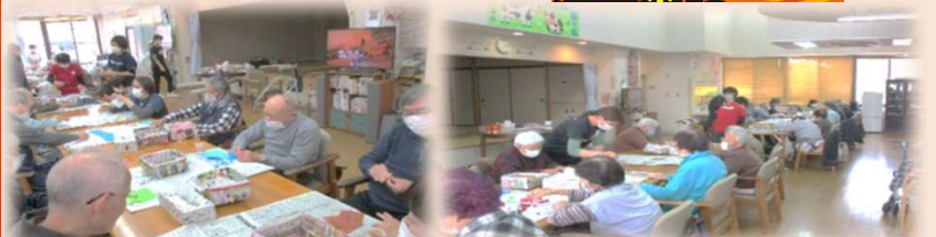
真剣そのもの。集中してます。