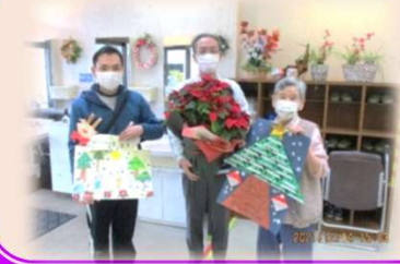
聖バルナバ保育園様より いただきました