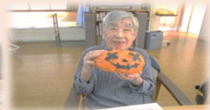
とても素敵な笑顔ですね