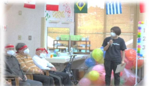
今年も頑張るで～(^ ^)vえいえいおー