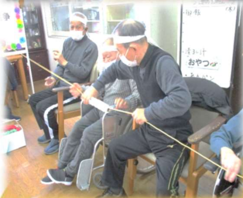
力持ちですよ、よいしょ！