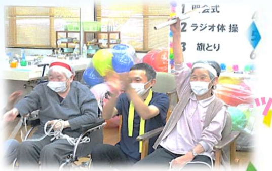
旗とり頑張りました～