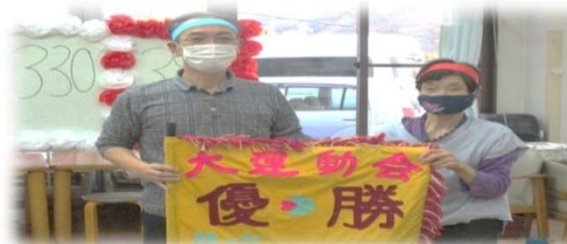
優勝は赤組 バンザイ！