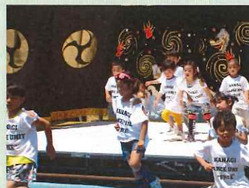
「キッズダンス FREE 様」