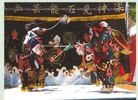
「上内田保存会様 石見神楽」