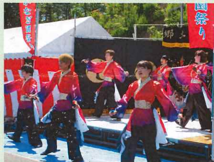
「島根県立大学よさこい橙蘭様」