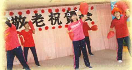
「職員 エピカニクスダンス」

園児さんたちによる元気いっぱいの歌やダンスを披露してくれました。かわいい手でご利用者様にやさしくタッチしてくれました。みなさん自然と表情がほころびます。ぜひまた遊びに来てくださいね!!