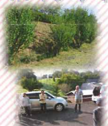
家族会の皆様による奉仕作業