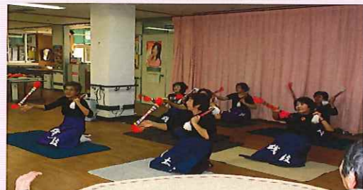
なんじゃもんじゃの会様

くもぎ保育園様 おぐに保育園様 折り紙クラブ様 音楽クラブ様 雲城小学校様 おんぼらと会様 金城中学校様 吟詠会様 なんじゃもんじゃの会様 浜田第2中学校様 浜田東中学校様 旧友会様 ビハーラ浜田様 ビューティカレッジ様 福泉寺様 中川親子様 TANIMANIA様 浜っ子ハイヤの会様 上内田神楽保存会様 石州浜田太鼓団様 島根県美容業生活衛生同業組合浜田支部様 みつばクラブ様 上来原社中様 裁縫ボランティア様 金城町社協様 ほか