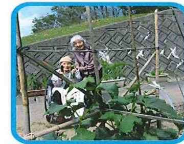
グリーンガーデン